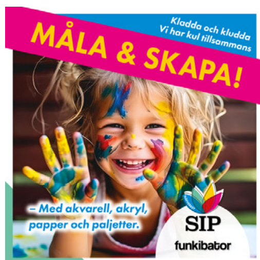
Vi arbetar med akrylfärg och lufttorkande lera